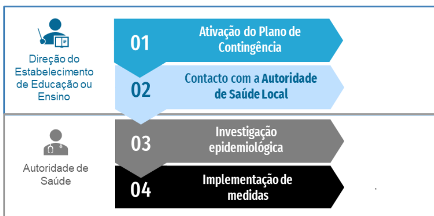
• Figura 2. Fluxograma de atuação perante um caso confirmado de COVID-19 em contexto escolar

de Contingência e contactado o ponto focal designado previamente pela Direção do estabelecimento de educação e/ou ensino (Anexo 2).